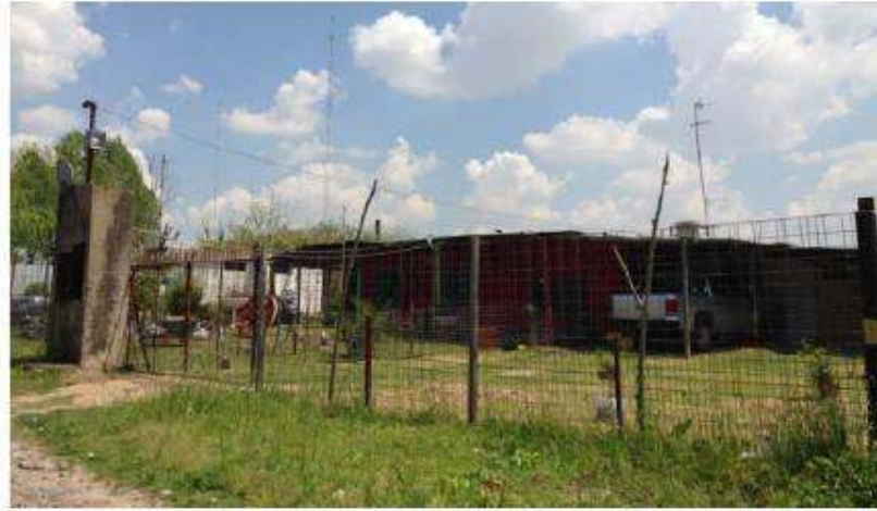
Figura N o 7 - Establecimiento industrial "TRI ECO SA" (L2, L3, L4)