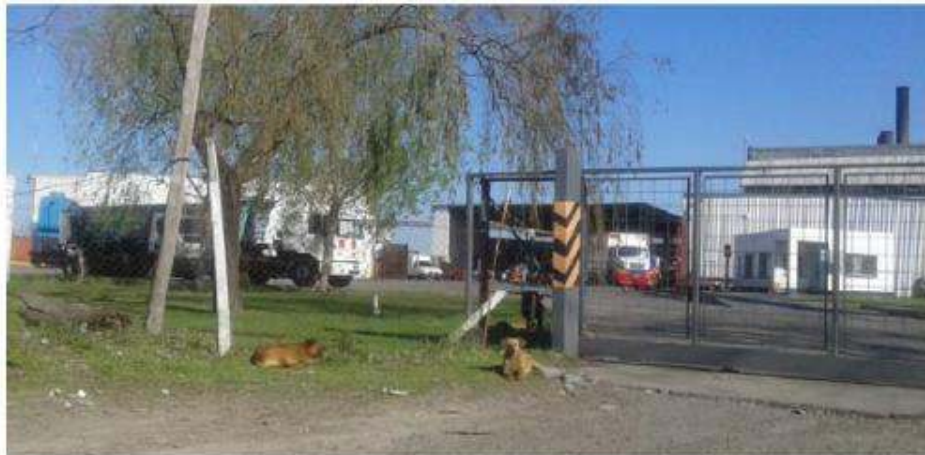
Figura N o 8 - Edificaciones linderas (L5)