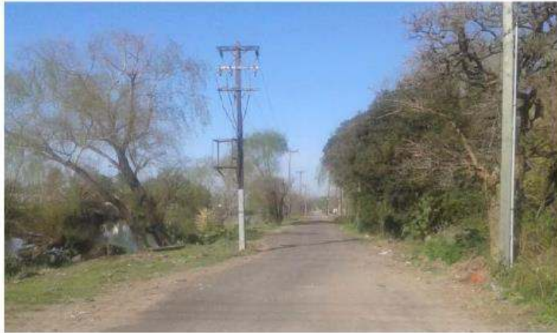
Figura N ° 2 - Situación General Actual

El proyecto contempla entre los principales trabajos el saneamiento de suelos no aptos, la materialización de terraplenes, la construcción de la base y sub-base para finalizar en una calzada pavimentada de hormigón armado de dos carriles por sentido de circulación. También se incluye la ejecución de cordones, veredas y desagües pluviales con las alcantarillas correspondientes, así como tendidos de iluminación y señalización tanto vertical como horizontal.