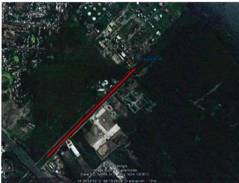
Figura N° 1 — Ubicación General

Este tramo de alrededor de 1200 m de longitud es en la actualidad un camino parcialmente pavimentado, de ancho variable y muy reducido en algunos sectores (4 a 5 metros de ancho), con pendiente transversal irregular y a un agua (desagüe hacia el Canal Sarandí) y que posee circulación de tránsito pesado, con lo cual las condiciones de circulación actuales para dicho tránsito son deficientes.